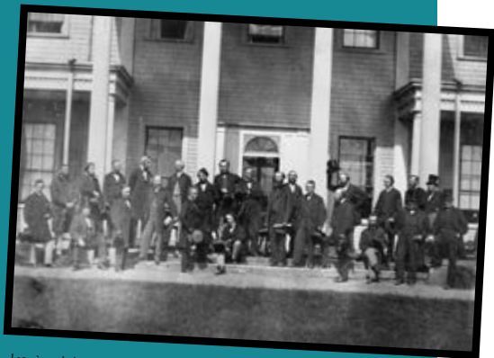
Les pères de la Confédération, en 1864, Bibliothèque et Archives Canada.