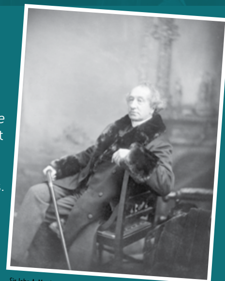
Sir John A. Macdonald

Cet outil a été développé pour les cours d'études sociales, d'histoire et d'instruction civique du niveau junior, soit de la 5 e à la 8 e année et de la 5 e année au secondaire II au Québec.