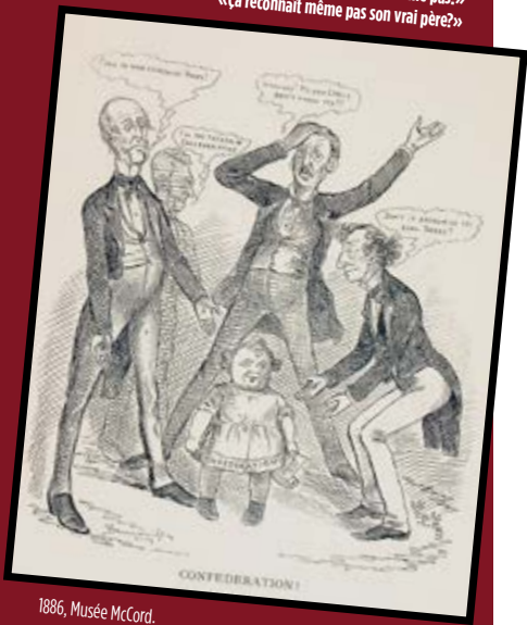
1886, Musée McCord.

«Viens voir ton vrai papa!» «C'est moi le Père de la Confédération!» «Mon dieu! Mon propre fils m'reconnait même pas!» «Ça reconnaît même pas son vrai père?»