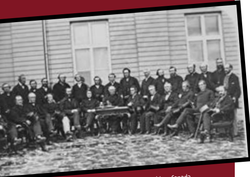
La conférence de Québec, 1864, Bibliothèque et Archives Canada.

Si le temps le permet, encouragez les étudiants à effectuer de la recherche additionnelle sur la période de la Confédération et d'analyser plus en profondeur comment les chercheurs utilisent les preuves.