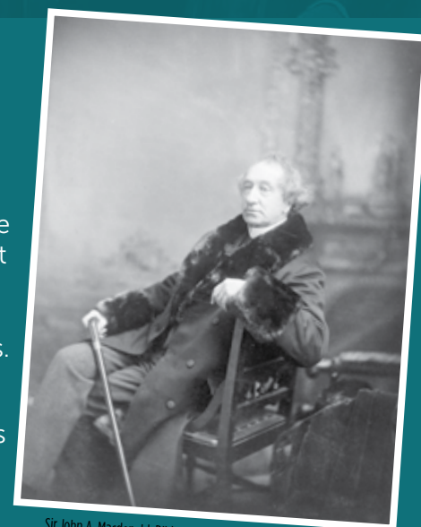
Sir John A. Macdonald, Bibliothèque et Archives Canada.

Cet outil a été développé pour les cours d'études sociales, d'histoire et d'instruction civique pour les classes de la 9 e à la 12 e année et du secondaire III jusqu'au secondaire V au Québec.