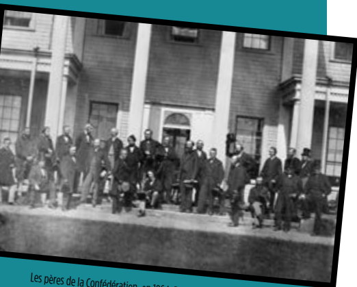
Les pères de la Confédération, en 1864, Bibliothèque et Archives Canada.

L'histoire est un dialogue entre les gens à propos de l'interprétation de preuves significatives nous parvenant du passé.